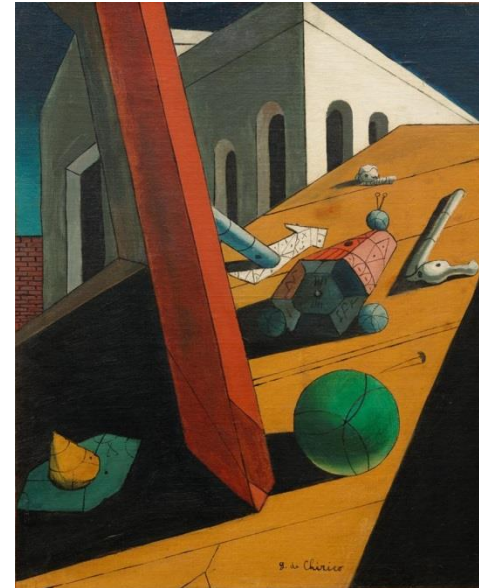
Bild: Giorgio de Chirico, Der böse Genius eines Königs , 1914-15, Paris

Graduate Centre (C9 3), Universität des Saarlandes, Saarbrücken