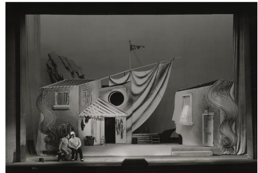
Foto: Bohuslav Martinů, Juliette , Uraufführung 1938, Nationaltheater Prag